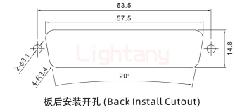
板后安装开孔 (Back Install Cutout)